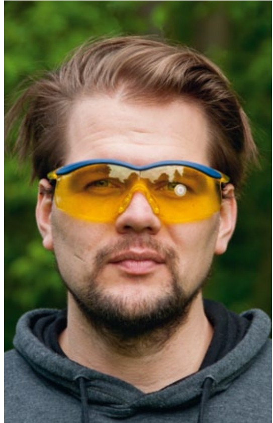
Brille und Schießbrille mit magnetischen Kunststoffscheiben zu Ermittlung der Augendominanz

Die Verwendung von Schießbrillen bringt noch weitere Vorteile für das Flintenschießen mit sich. Der Kontrast zur Wurfscheibe kann sich bei Verwendung der jeweils richtigen Farbwahl des Brillenglases deutlich verbessern. Unterschiedliche Tönungen für unterschiedliche Witterungsbedingungen optimieren dies noch einmal.