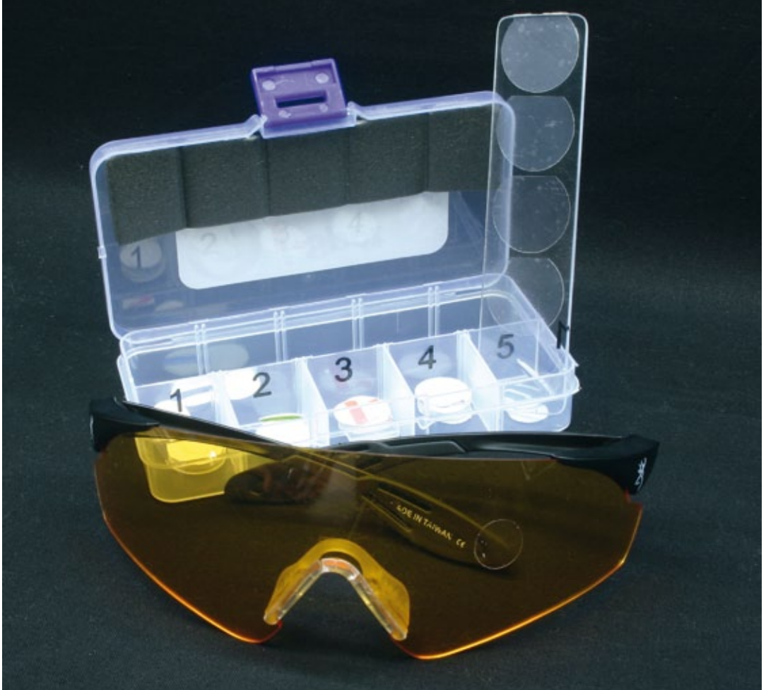
Schießbrille mit einer Auswahl an Folienpunkten

Durch eine über die CPSA bewährte Ermittlungsmethode zur Bestimmung der Sehkraftverteilung kann durch die Verwendung von kleinen Hilfsmitteln das nicht zielende Auge soweit geschwächt werden, dass das zielende an deutlicher Dominanz gewinnt und ein kontrolliertes, sicheres Schießen mit beiden geöffneten Augen ermöglicht.