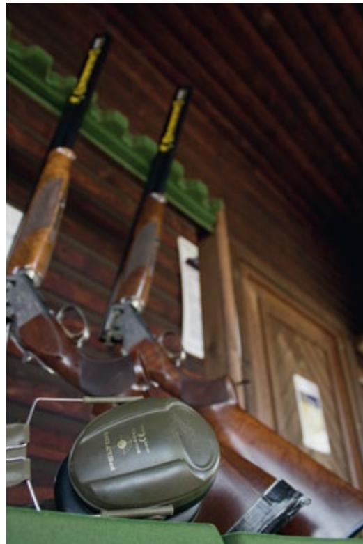
Die Flinte hat keine vergleichbare Zieloptik wie eine Büchse

Sind beide Augen geöffnet, ergeben sich keine Einschränkungen im Blickwinkel und im Blickfeld des Schützen. Daraus resultieren ein »besseres« Sehen und eine bessere Zielaufnah-