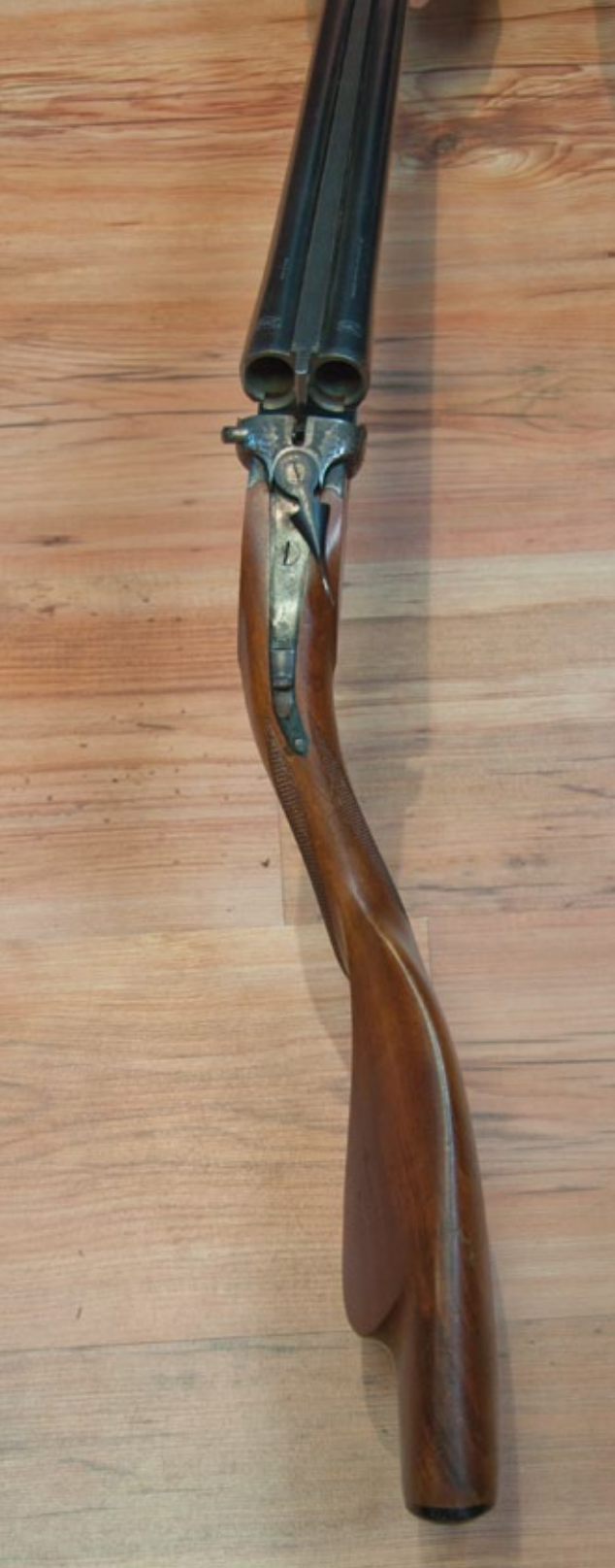
Stark gekröpfter Schaft für Rechtshänder mit linkem Zielauge

klappe. Betrachtet man den schon extrem unsicheren Gang einiger dieser Schützen zum Schützenstand wird jedem schnell klar, dass jemand mit unsicherem Gang und erkennbaren Gleichgewichtsproblemen wohl kaum in der Lage sein wird, sicher und kontrolliert, regelmäßig seine Ziele zu Treffen (siehe auch Artikel »Schaftanpassung«, Stichwort »waagerechte Augachse«). Vielmehr beschneidet der Schütze in diesem Fall seinen Blickwinkel und sein Sehfeld derart, dass er beim Aufnehmen diverser Wurfscheiben und Ziele, seinen Körper in keine optimale Zielaufnahme-Position bringen kann, und als Folge dadurch keine gute Zielaufnahme und Zielerfassung zur Verfügung hat.